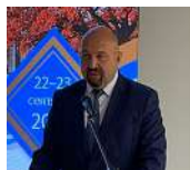
Пахоменко Константин Валентинович, министр здравоохранения Калужской области