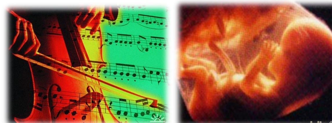
Рис. 2. Музыка – самый сильный интегрирующий фактор

Через нейроэндокринную систему музыка оказывает воздействие практически на все системы и органы ребенка: изменяется частота дыхания, тонус мышц, моторика желудка и кишечника. Беременность — это не только формирование ребенка, но и потрясающий шанс повлиять на интеллект, творческие и музыкальные способности малыша. Исследования американских ученых показали, что всего лишь десятиминутное прослушивание фортепианной музыки Моцарта показало повышение так называемого коэффициента интеллекта в среднем на 8-9 единиц. С помощью музыки можно регулировать диссинхронные ритмы, появляющиеся в мозге при стрессе.