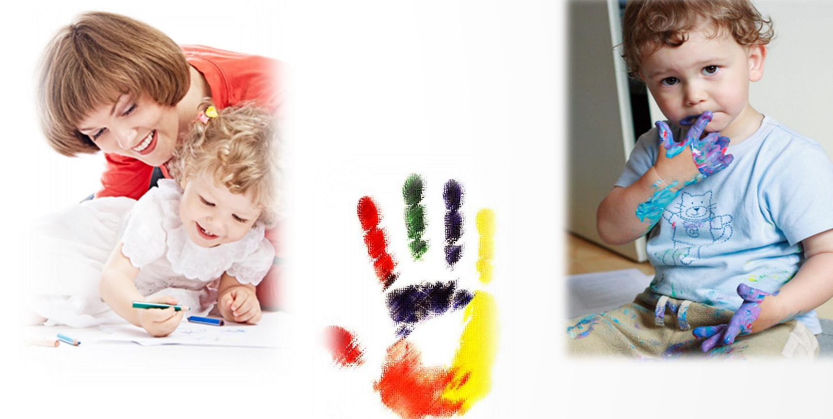
Рис. 3 Арт-терапия