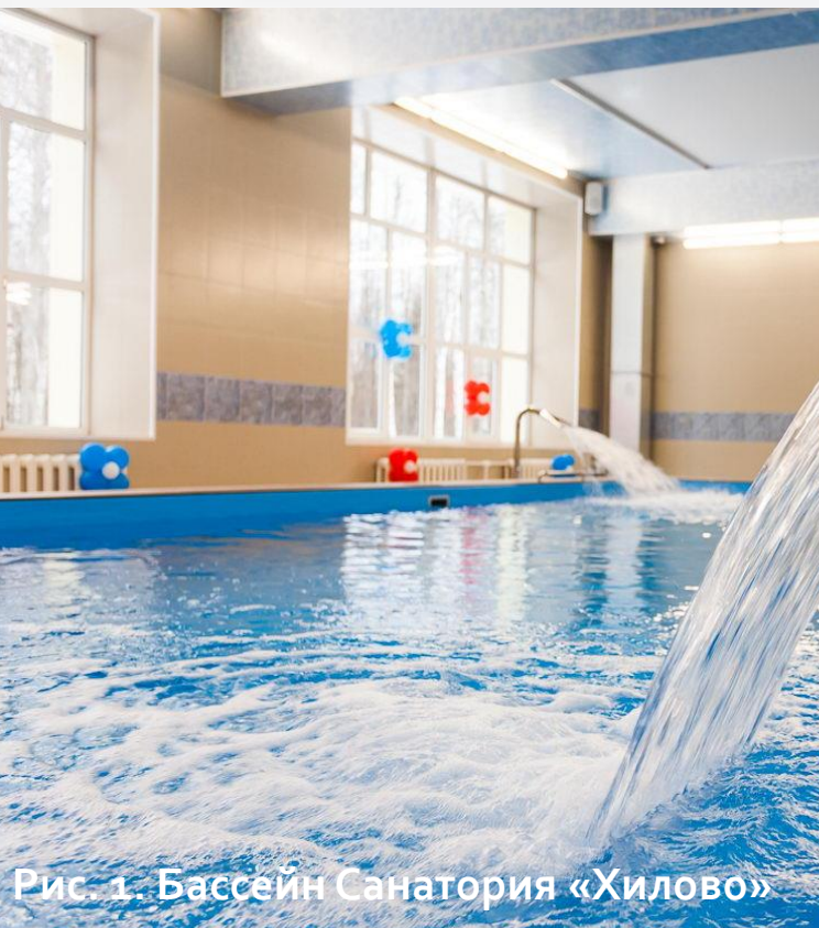
Рис. 1. Бассейн Санатория «Хилово»