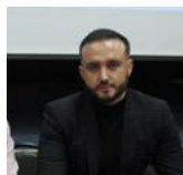
Селиверстов Константин Олегович, заместитель министра здравоохранения Новгородской области