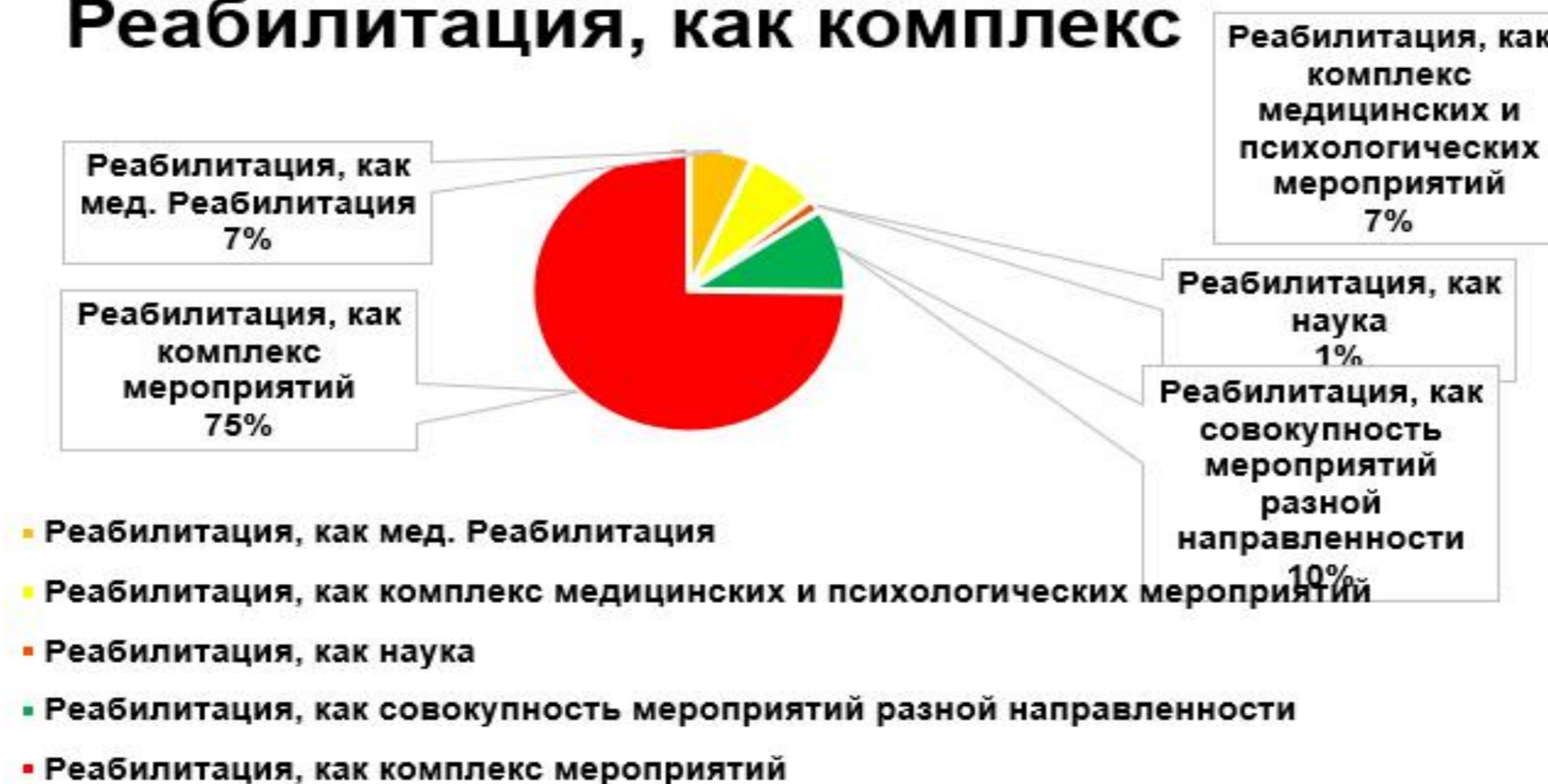
Диаграмма 1. Реабилитация, как комплекс