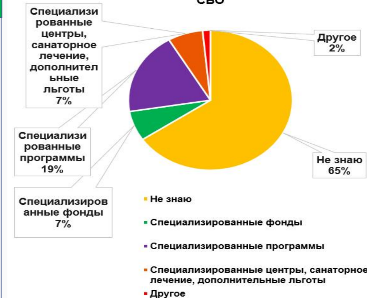
Диаграмма 2. Реабилитация участников СВО