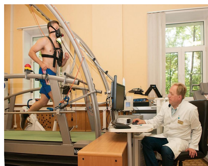
Рисунок 1. Реабилитационный процесс