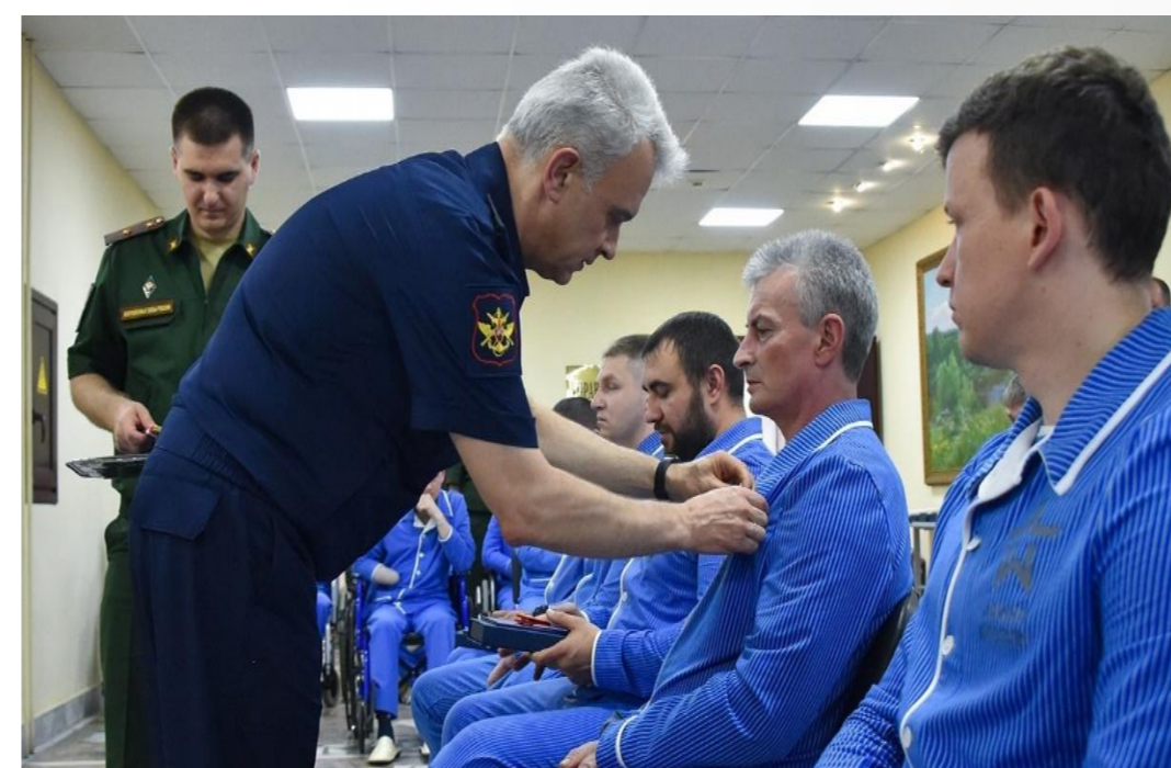
Рисунок 2. Награждение участников СВО