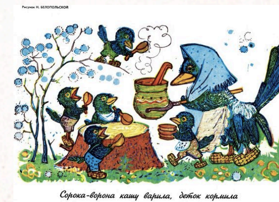
Сорока-ворона кашу варила, деток кормила